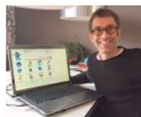
Hulp bij Cyclos