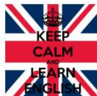
Hulp bij Engels