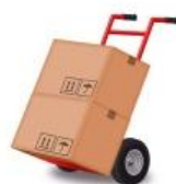
Hulp bij verhuizen