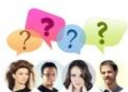
Op weg naar een oplos...